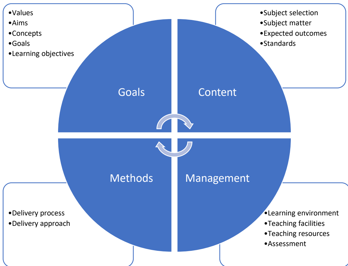
Fig. 1: Dimensioner av en läroplan (se Maňák, Janík & Švec 2008).